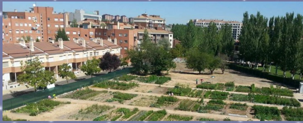
Huerto Urbano "Los Santos-Pilarica".

Degustaremos los productos de este huerto urbano, que nos brindan de la zona comunal con todo su cariño.