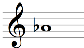
Figura 2: https://comamusical.com/bemol/